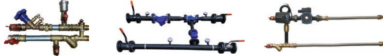
Узлы регулирования фанкойлов. Любой комплектации. Производство от одного дня Сварные узлы регулирования для вентиляционных установок. От 65 до 250 DN Производство от одного дня Узлы регулирования для вентиляционных установок. Производство от одного дня